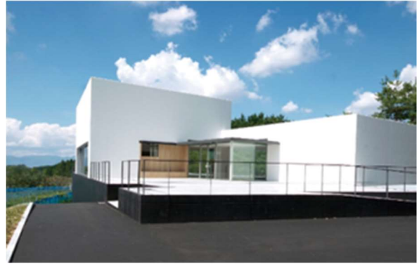
栗東ワイナリー外観