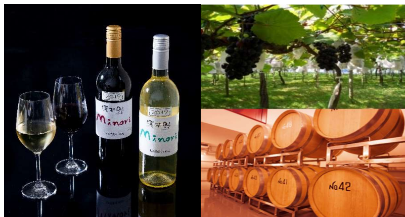
「2019 浅柄野 Minori」イメージ