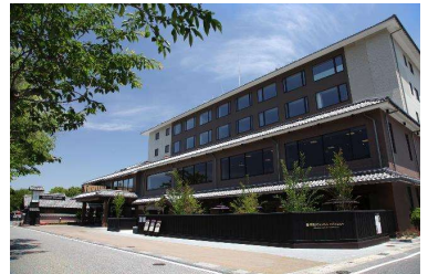
彦根キャッスルリゾート&スパ