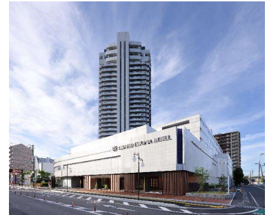
クサツエストピアホテル