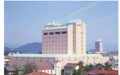
ホテルニューオウミ