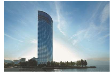
びわ湖大津プリンスホテル